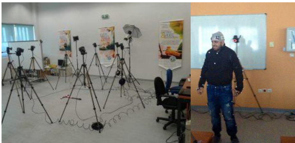
Σύστημα Λήψης Κίνησης (Motion Capture System) και Δημιουργίας Εικονικών Χαρακτήρων από Ανθρώπινους Χαρακτήρες