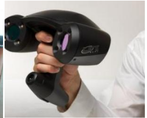
3d – Scanners