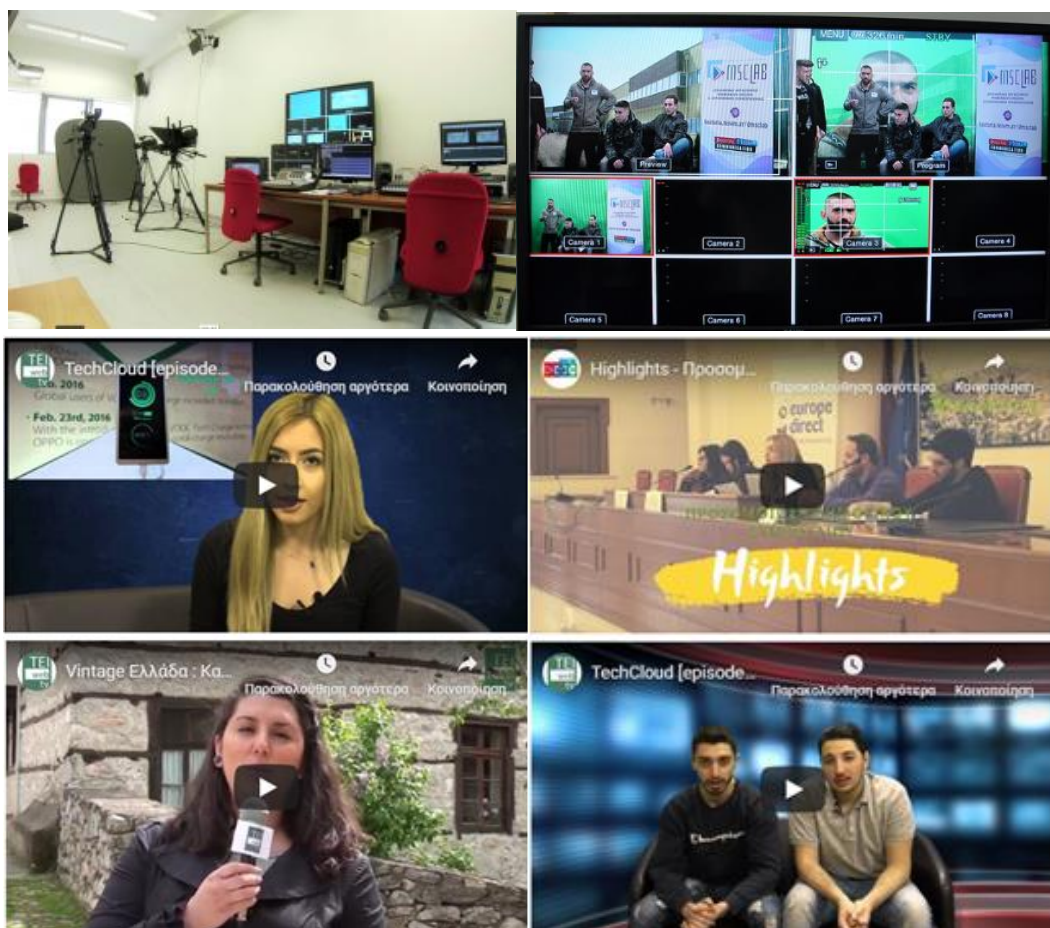
Υπερσύγχρονο Studio WebTV