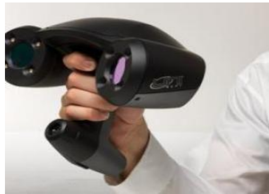
3d – Scanners