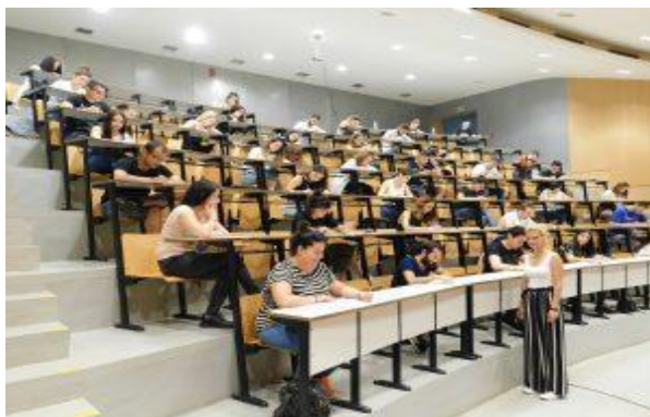
Αμφιθέατρο 120 θέσεων

εξοπλισμένα με ΗΥ, 3 αίθουσες διδασκαλίας πλήρως εξοπλισμένες με οπτικοακουστικά μέσα διδασκαλίας, 1 αμφιθέατρο 120 θέσεων, θεσμοθετημένο εργαστήριο Ψηφιακών Μέσων και Στρατηγικής Επικοινωνίας, εργαστήριο με υπερσύγχρονο εξοπλισμό studio webtv, Motion Capture cameras για Animation Production, 3D Scanners, 3D Cameras & 3D TV and Monitors, λογισμικά επεξεργασίας και δημιουργίας 3d παραγωγών, βίντεο και εικόνας, εξοπλισμό μεικτής πραγματικότητας κ.α. Οι υποδομές του Τμήματος είναι διαθέσιμες στην σελίδα: https://cdm.uowm.gr/υποδομές/