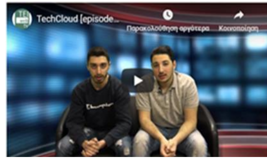
Υπερσύγχρονο Studio WebTV