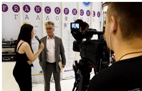
Ομάδα Επικοινωνίας σε δράση