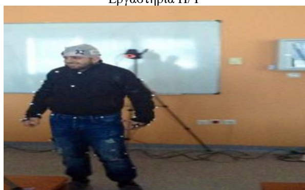
Σύστημα Λήψης Κίνησης (Motion Capture System) και Δημιουργίας Εικονικών Χαρακτήρων από Ανθρώπινους Χαρακτήρες