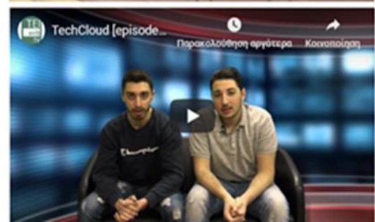
Υπερσύγχρονο Studio WebTV