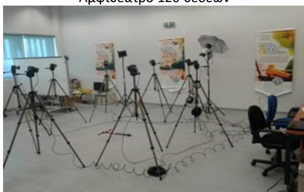
Σύστημα Λήψης Κίνησης (Motion Capture System) και Δημιουργίας Εικονικών Χαρακτήρων από Ανθρώπινους Χαρακτήρες