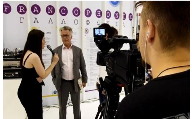
Ομάδα Επικοινωνίας σε δράση