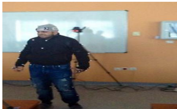
Σύστημα Λήψης Κίνησης (Motion Capture System) και Δημιουργίας Εικονικών Χαρακτήρων από Ανθρώπινους Χαρακτήρες