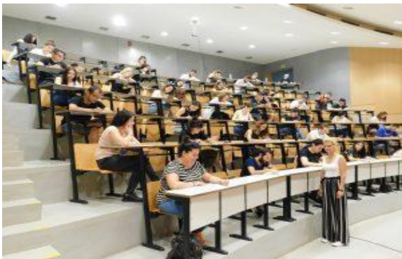
Αμφιθέατρο 120 θέσεων

Το Τμήμα διαθέτει υπερσύγχρονο εξοπλισμό που καλύπτει πλήρως το πρόγραμμα σπουδών του καθώς και τις ερευνητικές του δραστηριότητες. Ενδεικτικά διαθέτει 4 εργαστήρια πλήρως εξοπλισμένα με ΗΥ, 3 αίθουσες διδασκαλίας πλήρως εξοπλισμένες με οπτικοακουστικά μέσα διδασκαλίας, 1 αμφιθέατρο 120 θέσεων, θεσμοθετημένο εργαστήριο Ψηφιακών Μέσων και Στρατηγικής Επικοινωνίας, εργαστήριο με υπερσύγχρονο εξοπλισμό studio webtv, Motion Capture cameras για Animation Production, 3D Scanners, 3D Cameras & 3D TV and Monitors, λογισμικά επεξεργασίας και δημιουργίας 3d παραγωγών, βίντεο και εικόνες, εξοπλισμό μεικτής πραγματικότητας κ.α. Οι υποδομές του Τμήματος είναι διαθέσιμες στην σελίδα: https://cdm.uowm.gr/υποδομές/