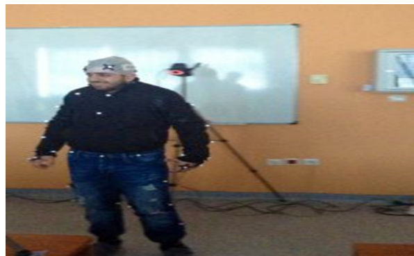
Σύστημα Λήψης Κίνησης (Motion Capture System) και Δημιουργίας Εικονικών Χαρακτήρων από Ανθρώπινους Χαρακτήρες