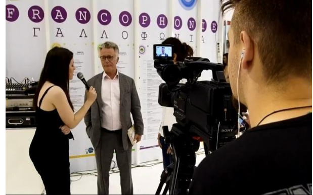
Ομάδα Επικοινωνίας σε δράση